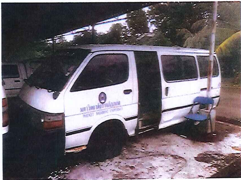
รูปภาพที่ 3,4 รถยนต์นั่งส่วนบุคคลหมายเลขทะเบียน นก-3878 ภูเก็ต