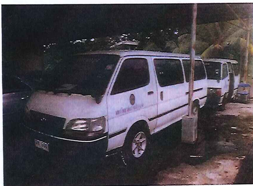
รูปภาพที่ 1,2 รถยนต์นั่งส่วนบุคคลหมายเลขทะเบียน นข-566 ภูเก็ต