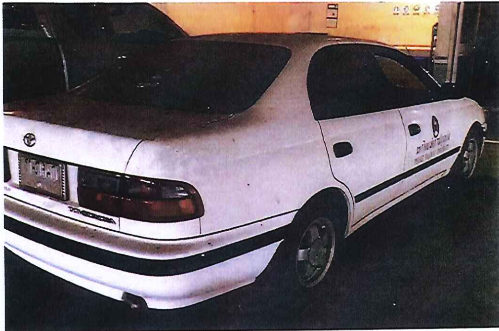
รูปภาพที่ 13,14 รถยนต์นั่งส่วนบุคคลหมายเลขทะเบียน ข-3680 ภูเก็ต